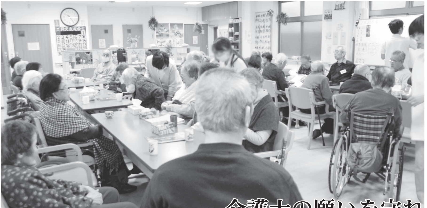
▶福祉施設の様子(写真はイメージです)