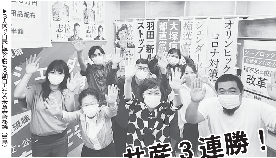
▶3人区で自民に競り勝ち3期目となる米倉春奈都議(豊島)