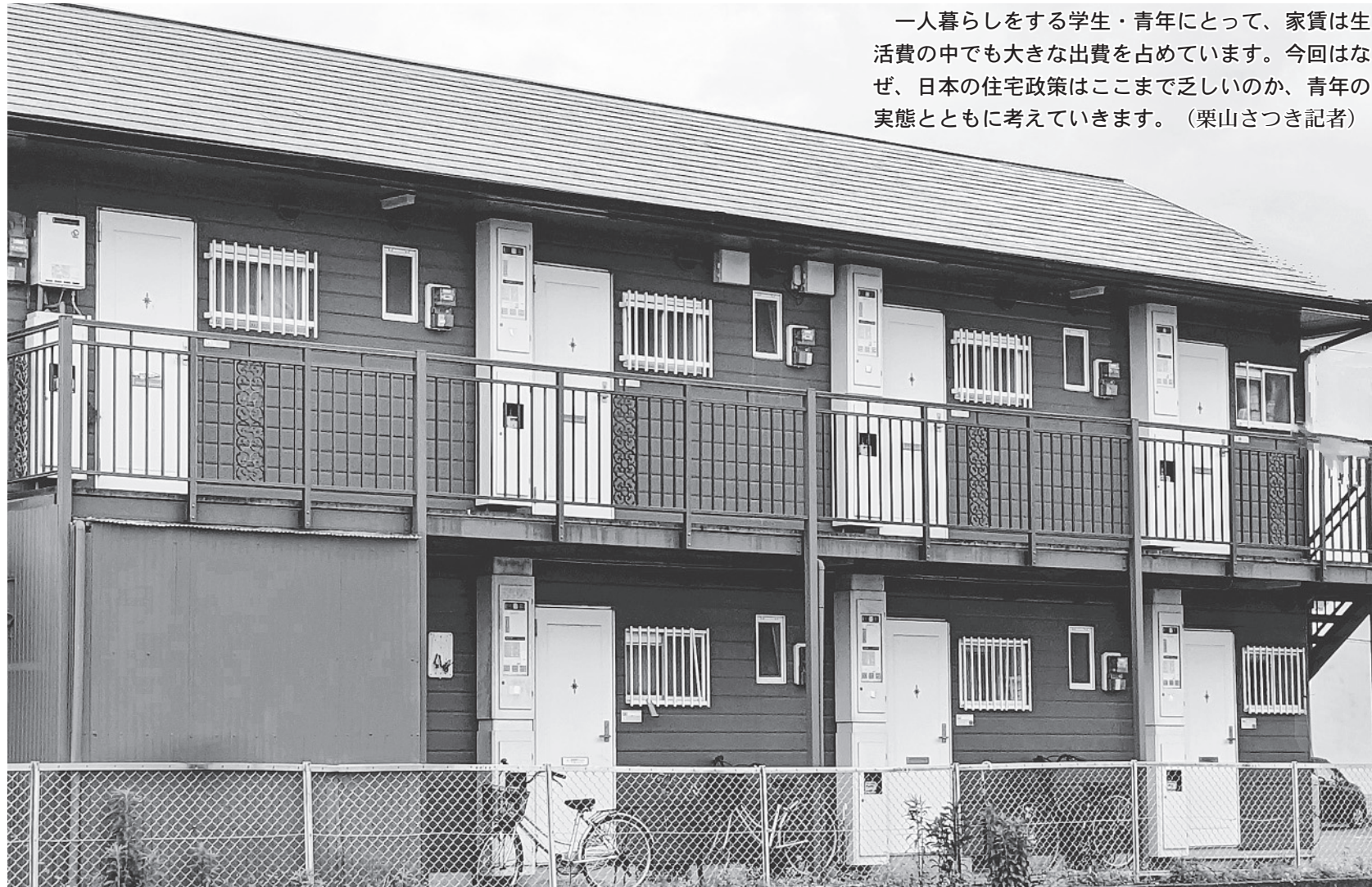
▶一般的な一人暮らしのアパート(写真はイメージです)

一人暮らしをする学生・青年にとって、家賃は生活費の中でも大きな出費を占めています。今回はなぜ、日本の住宅政策はここまで乏しいのか、青年の実態とともに考えていきます。(栗山さつき記者)